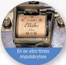
En av våra första impulsbrytare