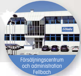
Försäljningscentrum och administration Fellbach