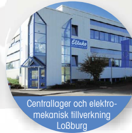
Centrallager och elektromekanisk tillverkning Loßburg