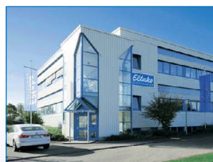
Centrallager och tillverkning av elektromekanisk utrustning i Lossburg