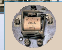
Ett av våra första impulsreläer