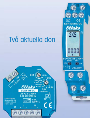
Två aktuella don