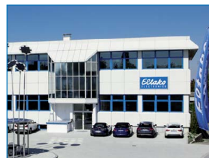
Distributionscentrum och förvaltning i Fellbach

I linje med den betydelse som elektroniska produkter har för företagets omsättning, ändrades 2006 Eltakos logga till att inkludera ordet "Electronics" som är internationellt förståligt. Fastän att de elektromekaniska enheterna fortfarande tillverkas i stora mängder, kommer de elektroniska enheterna att stå för mer än 80 procent av den totala omsättningen.