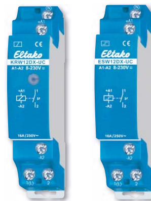
E 40 016 32 Arbetsströmrelä

Eltakos nya reläer för höga startströmmar använder en wolframkontakt som sluter strax före den vanliga reläkontakten och klarar därför en startström på 500 A / 2 ms. Det skötar styrutrustning och ljuskällor samt bidrar till en ökad livslängd. Vissa av dagens LED-lampor har höga startströmmar som kan skapa problem i den fasta installationen, som brända eller klibbade kontakter på reläer och strömbrytare.