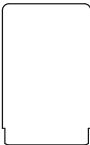
B: Servicekort för hotellpersonal KCS