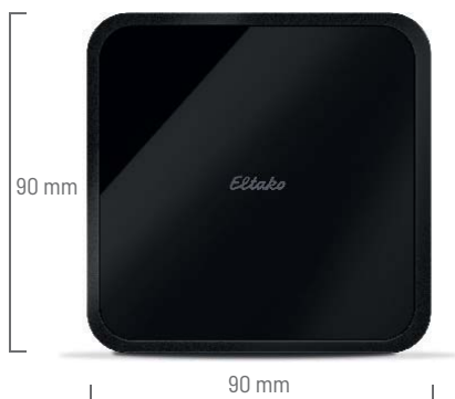
MiniSafe2 Controlador Smart Home