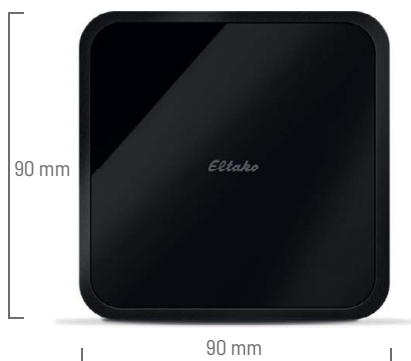
Controlador Smart Home