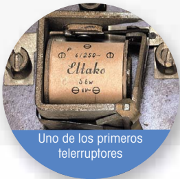
Uno de los primeros telerruptores