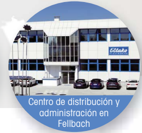
Centro de distribución y administración en Fellbach