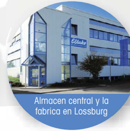
Almacén central y la fábrica en Lossburg