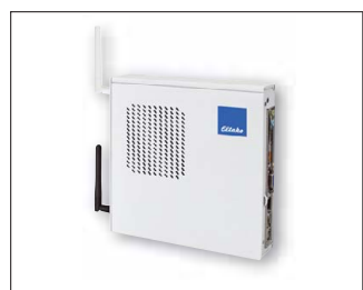
Safe IV, reinweiß