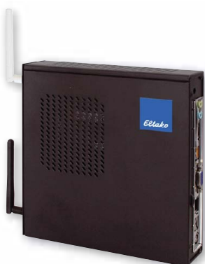
Safe IV, schwarz