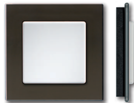
Glasrahmen schwarz mit Korpus schwarz