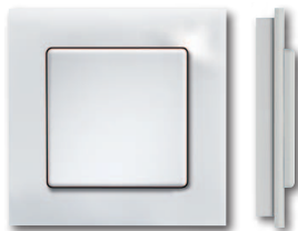
Kunststoffrahmen glänzend weiß