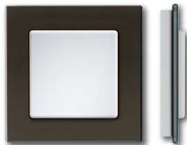
Glasrahmen schwarz mit Korpus glänzend weiß

Die Q-Rahmen werden als Zubehör geliefert, die Taster FT55 müssen zusätzlich bestellt werden.