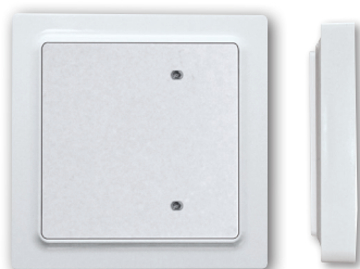
Bus-Taster mit Wippe