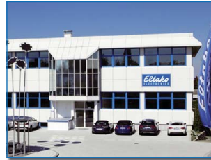
Vertriebszentrum und Verwaltung Fellbach

Gemäß der Bedeutung des hohen Elektronikanteiles am Umsatz des Unternehmens wurde das Eltako-Logo bereits 2006 mit dem auch international lesbaren Zusatz ELECTRONICS versehen. Obwohl die elektromechanischen Schaltgeräte immer noch in großer Stückzahl gefertigt werden, entfallen mehr als 80 Prozent des Gesamtumsatzes auf die Elektronik.