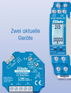
Zwei aktuelle Geräte