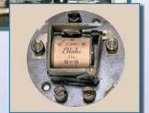
Einer unserer ersten Stromstoßschalter