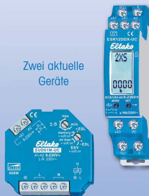
Zwei aktuelle Geräte