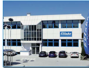
Vertriebszentrum und Verwaltung Fellbach

Gemäß der Bedeutung des hohen Elektronikanteiles am Umsatz des Unternehmens wurde das Eltako-Logo bereits 2006 mit dem auch international lesbaren Zusatz ELECTRONICS versehen. Obwohl die elektromechanischen Schaltgeräte immer noch in großer Stückzahl gefertigt werden, entfallen mehr als 80 Prozent des Gesamtumsatzes auf die Elektronik.