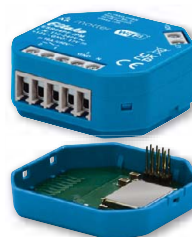
Baureihe 64 mit EnOcean-Adapter EOA64