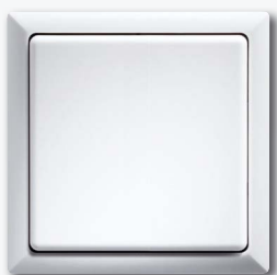
Vlakke drukknop met toets