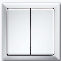
Vlakke drukknop met dubbele toets