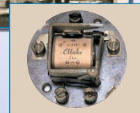
Ett av våra första impulsreläer