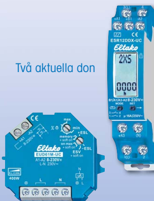
Två aktuella don