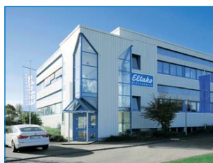
Centrallager och tillverkning av elektromekanisk utrustning i Lossburg