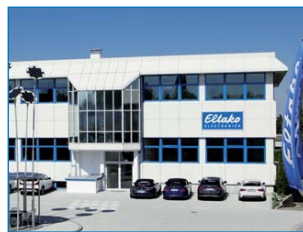
Distributionscentrum och förvaltning i Fellbach

I linje med den betydelse som elektroniska produkter har för företagets omsättning, ändrades 2006 Eltakos logga till att inkludera ordet "Electronics" som är internationellt förståligt. Fastän att de elektromekaniska enheterna fortfarande tillverkas i stora mängder, kommer de elektroniska enheterna att stå för mer än 80 procent av den totala omsättningen.