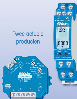
Twee actuele producten