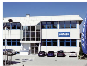
Het hoofdkantoor in Fellbach

Hoewel de oude vertrouwde elektromechanische producten nog steeds in zeer grote aantallen geproduceerd worden, wordt ruim 80% van de totale omzet tegenwoordig gerealiseerd met deze elektronica producten.