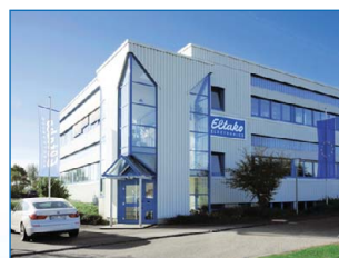
De productie en het centraal magazijn in Loßburg