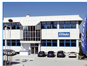
Centro distribuzione ed amministrazione a Fellbach

In armonia con la percentuale di vendita dell'elettronica significativa, già nel 2006 è stata posta al logo Eltako l'aggiunta leggibile internazionale ELECTRONICS. Anche se le apparecchiature elettromeccaniche vanno ancora prodotte in gran numero, oltre l'80 per cento del totale delle vendite va rappresentato dall'elettronica.