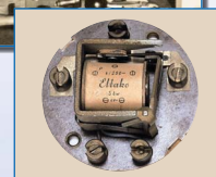
Uno dei nostri primi relè passo-passo