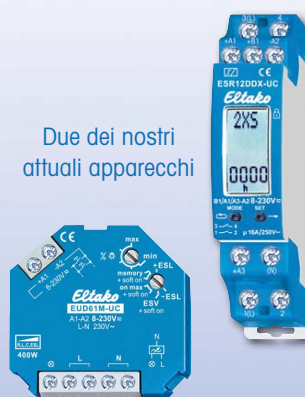
Due dei nostri attuali apparecchi