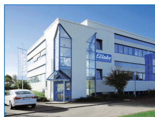
Magazzino centrale ed elettromeccanica - Produzione a Loßburg