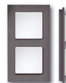
Cadre plastique anthracite