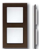
Cadre verre noir corps blanc brillant

Dimension 84x156 mm , le reste comme le cadre simple QR1.