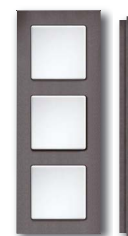
Cadre plastique anthracite