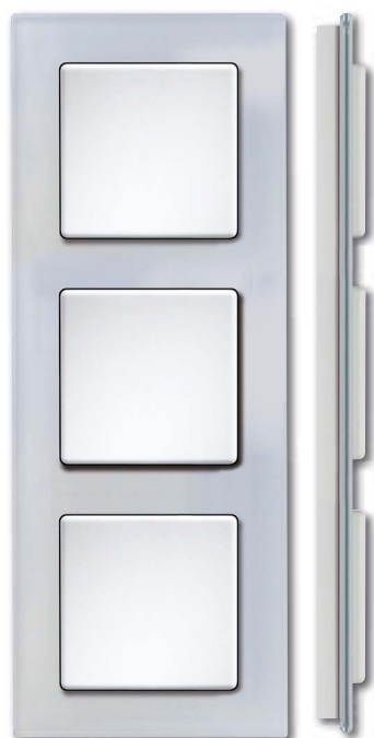
Cadre en verre blanc avec corps blanc brillant