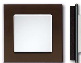
Cadre en verre noir avec corps noir