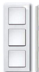
Cadre plastique blanc brillant