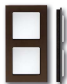
Cadre verre noir corps noir