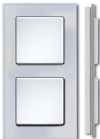
Cadre en verre blanc avec corps blanc brillant