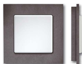
Cadre en matière plastique anthracite