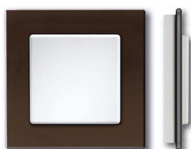
Cadre en verre noir avec corps blanc brillant

Les cadres Q sont fournis comme accessoire, les poussoirs FT55 doivent être commandés séparément.