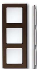
Cadre verre noir corps blanc brillant

Dimension 84x227mm, le reste comme le cadre simple QR1.