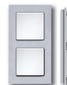
Cadre plastique alu-argenté