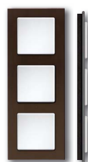
Cadre verre noir corps noir