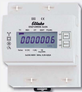
Ejemplo de conexión 3 fases mas N 3x230/400V