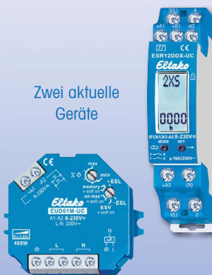
Zwei aktuelle Geräte