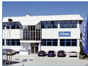
Vertriebszentrum und Verwaltung Fellbach

Gemäß der Bedeutung des hohen Elektronikanteiles am Umsatz des Unternehmens wurde das Eltako-Logo bereits 2006 mit dem auch international lesbaren Zusatz ELECTRONICS versehen. Obwohl die elektromechanischen Schaltgeräte immer noch in großer Stückzahl gefertigt werden, entfallen mehr als 80 Prozent des Gesamtumsatzes auf die Elektronik.