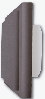
FT4F-an mit FTB

Funktaster-Beleuchtung mit LED zum Anrasten von hinten an die leitungslosen Funktaster. Versorgungsspannung 8 bis 24 V UC. Stand-by-Verlust nur 0,04 - 0,1 Watt.