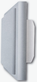
FT4F-si mit FTB

Funktaster-Beleuchtung mit LED zum Anrasten von hinten an die leitungslosen Funktaster. Versorgungsspannung 230 V. Stand-by-Verlust nur 0,1 Watt.