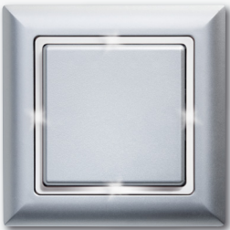
FT4-al mit ZR-op

Um die Beleuchtungsstärke zu vermindern, kann der opake Deckel durch einen der beiden beiliegenden eingefärbten Deckel ersetzt werden. Einen dieser Deckel unbedingt wieder aufsetzen, sonst besteht die Gefahr eines Stromschlages.