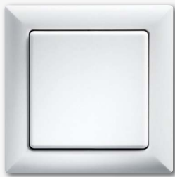
Funk-Sensortaster mit einer Tastfläche