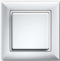
Funk-Sensortaster mit Zwischenrahmen und mit einer Tastfläche