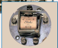
Náš první impulsní spínač