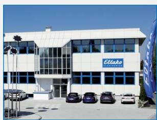
Centrála odbytu a sídlo vedení ve Fellbachu