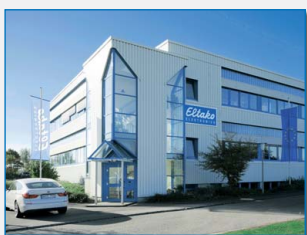
Centrální sklad a elektro- mechanická výroba v Loßburgu